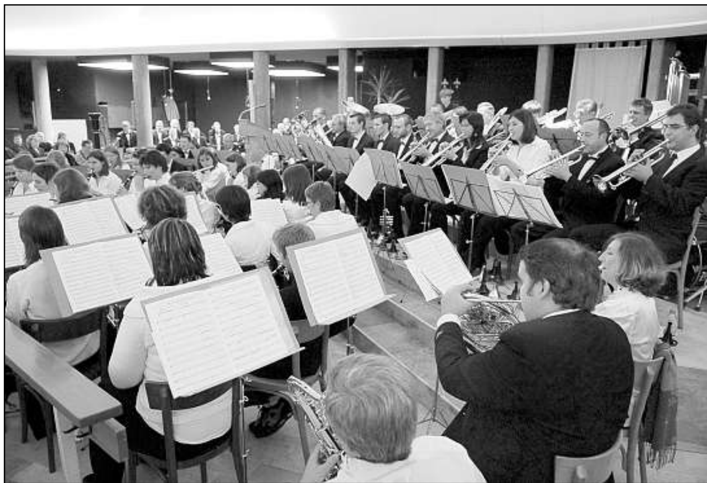
La surprise de la programmation a été l'interprétation de la musique du film Titani .