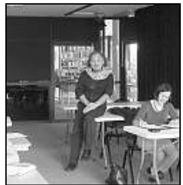
Prochain rendez-vous mardi.